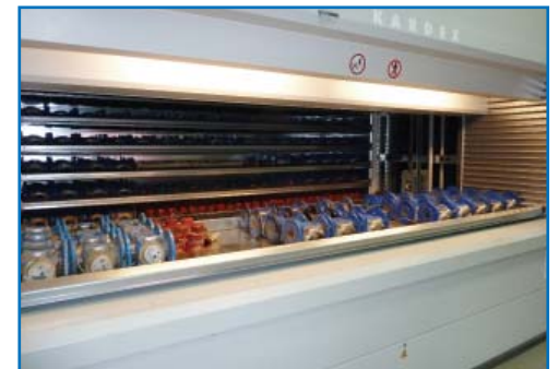
Компьютеризированная складская система учета и хранения приборов

диаметром 15-20 мм занимает не более часа и не зависит от выбранного способа проведения поверки.