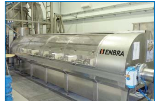
Поверочная установка для счетчиков воды диаметром от 50 до 200 мм

Если заявитель привезет счетчик на поверку в Центр самостоятельно, то стоимость поверки в таком случае составит 469,05 рублей. По времени процедура поверки одного квартирного счетчика