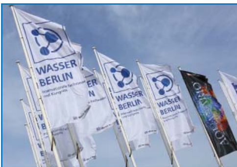
Мосводоканал принял участие в работе международной выставки Wasser Berlin- 2013