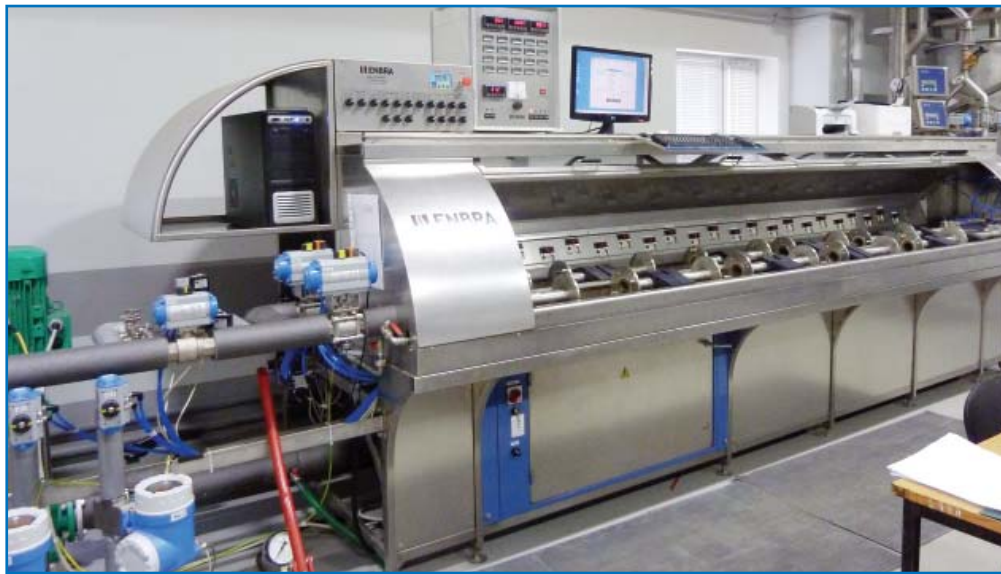
Поверочная установка для счетчиков воды диаметром от 15 до 50 мм

Центр учета воды – филиал ОАО «Мосводоканал» готов к «самостоятельной» работе по поверке водосчетчиков.