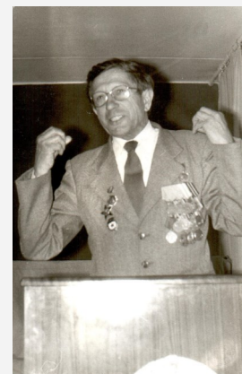
Отчёт о работе 1972 год