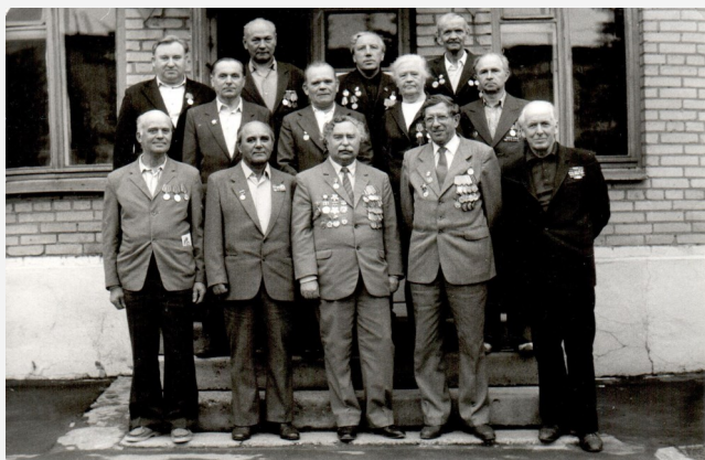
Работники ЗВС Участники ВОВ в День Победы